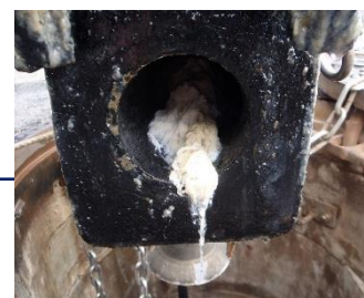
ポンプの吸込み口で詰まっている様子↑